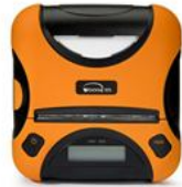
Woosim WSP-i350 条码打印机