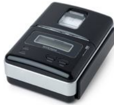
Woosim PORTI-SC40N 条码打印机