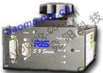
RJS SV Series条形码检测仪

RJS SV Series在线条码检测仪让条形码质量符合您的要求: 准确连续的条码检测方 码生产过程, 实时质量控制, 灵活, 易学易用的编程设定