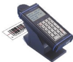
REA SCANCheck II 条形码检测仪