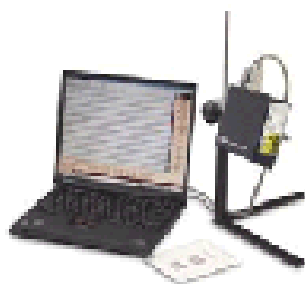
HHP QC OLV条形码检测仪

采用先进的数字信号处理（DSP）技术， 可保证快速处理、高速打印和精确分析， 带有5个可编程输出端口，用于实时控制打印机或传送带， 支持传统与美标检测方式。