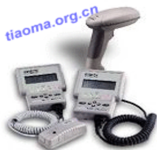
honeywell QC800桌面型条形码检测仪

采用传统和美标两种检测方式, 简便的台式全功自条码检测仪, 通过LCD和LED立即显示便于及时设定条码检测仪, 使用简便、外形小巧, 广泛适用于各种检测要求。