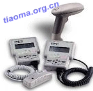
HHP QC600桌面型条形码检测仪

QC600系列条码检测仪能够采用传统和美标两种方式进行检测, 除可接光笔、鼠标型可接手持非接触式阅读器。