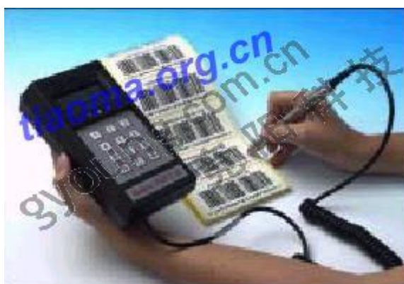
安利莱POPULAR条形码检测仪