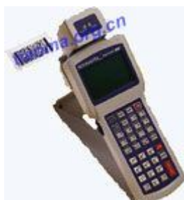
Xaminer-MD系列条形码检测仪

安利莱 POPULAR 最精密的便携式多功能条码检测设备 安利莱系列检测仪由英国AXCION 公司生产, AXCION公司是一家生产条码设备的专业 码原版胶片刻蚀机和条码检测仪而闻名于世。安利莱条码检测仪满足国际条码协会 条码印刷品质量检测的各项数据, 简单易用、数据精确、体轻易携。可适用于: 印刷业 印刷产品的条码质量检测 制造业 检测出厂产品修码标签之质量 零售业 进货前检测货品的条码标签, 以免在售货时扫描器无法识读而影响销售。 各级质量监督检测机构。