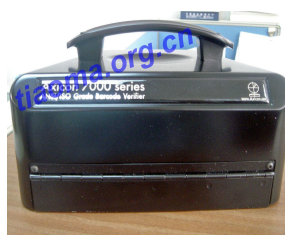
Axicon PC-7000系列条形码检测仪

系统要求: IBM或兼容的PC (推荐486或以上), Windows 95或更高版本。