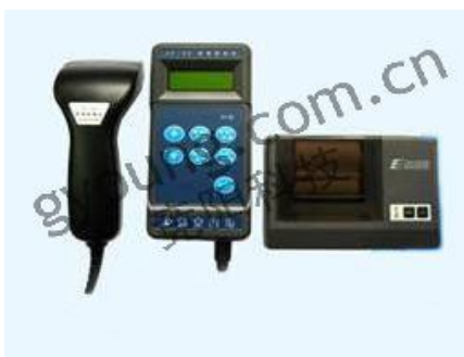
东方捷码JY-3C全中文条码检测仪

JY-3C条码检测仪集光、机、电、计算机技术于一体, 采用CCD识读方式, 根据国家标