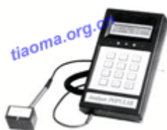
安利莱Analyzer条形码检测仪

扫描设备: 高分辨率不锈钢光笔, 五个指示灯显示条码偏差, 检验位计算: UPC/EAN, 显示屏, 具有声音提示, 使用简便、外形小巧, 广泛适用于各种检测要求